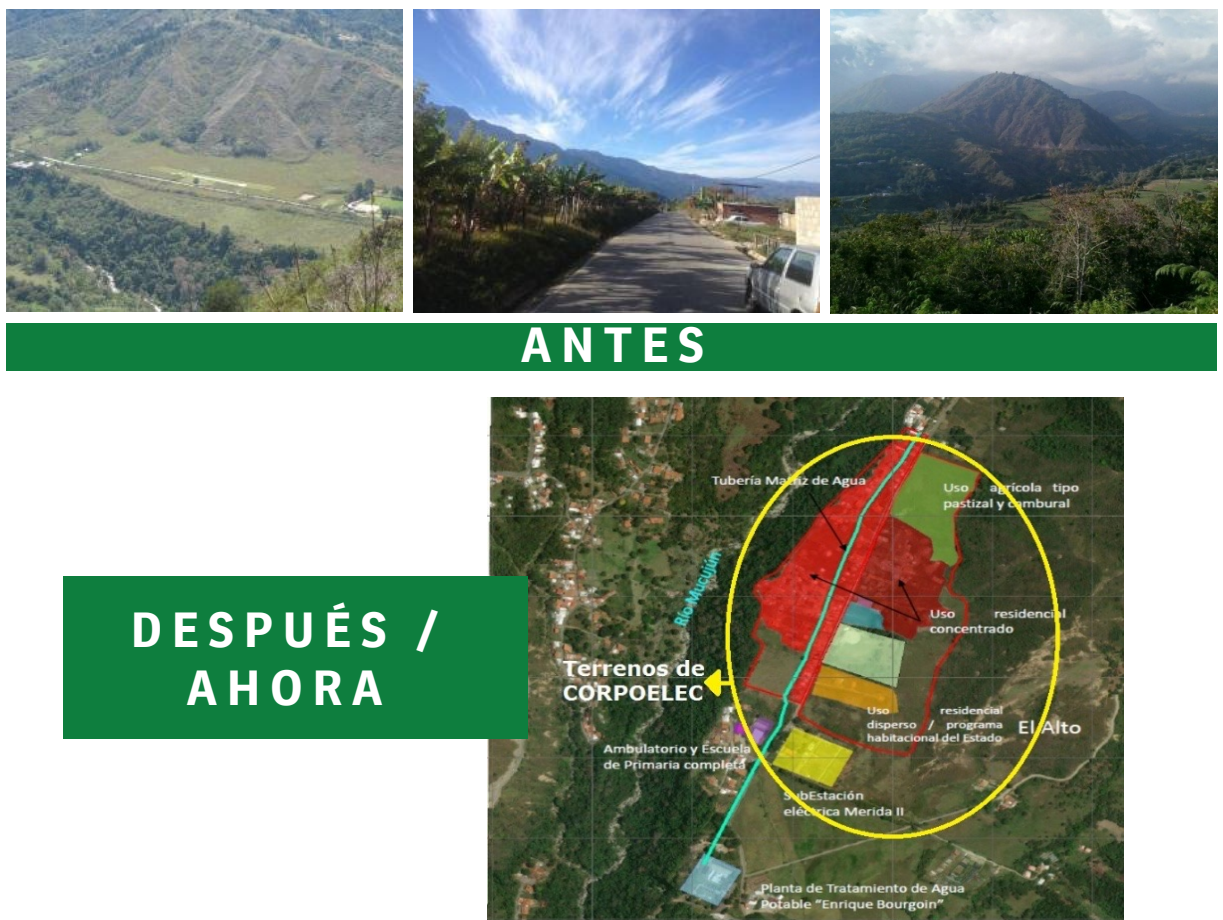
Figura 4. Vista Panorámica Sector el Estadio El Vallecito, (antes y después de su intervención) Fuente: Tomado de Colmenares, (2023) y modificado de Colmenares (2026)

Para categorizar la gobernanza ambiental y territorial que de la Zona protectora del Mucujún, uno de los aspectos más relevantes de la aplicación de las políticas públicas en la zona protectora del Mucujún es la debilidad institucional y los conflictos de gobernanza territorial, desencadenando en la carencia de mecanismos de gobernanza y en la falta de coordinación entre las instituciones responsables de la gestión ambiental y territorial, resultante de la confrontación que se configura en función de los intereses, valores e identidades de los actores involucrados en el proceso político de gobernanza. Tal como se refleja en los conflictos socioambientales y las transformaciones del espacio territorial, de los terrenos de Corpoelec en El Vallecito; convertidos en centro urbano residencial, sin planificación de la estructura urbana (servicios públicos). Ver FIG 4.