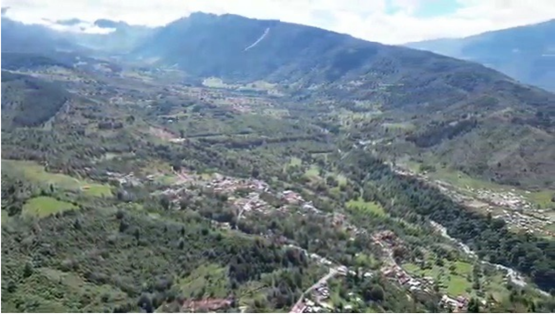
Figura 2. Vista Panorámica de la Subcuenca del Mucujún