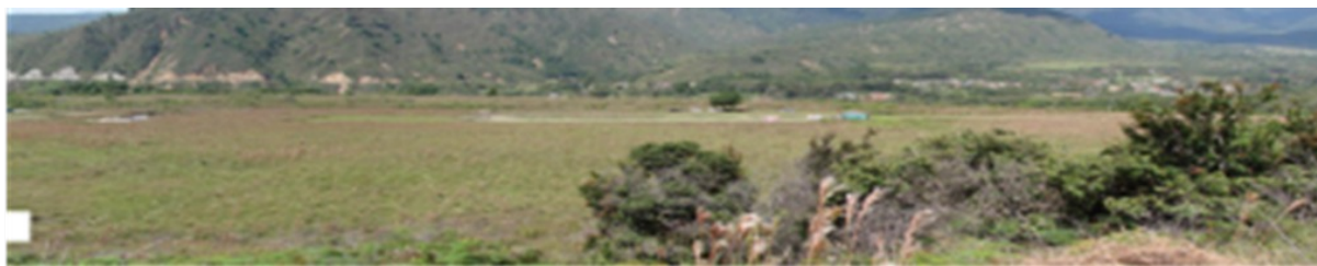
Figura 3. Vista Panorámica Sector el Estadio El Vallecito, (antes de su intervención)

Los conflictos socioambientales y las transformaciones del espacio territorial, asociados a la presión de tipo: sociales, políticos, económicos, culturales y ambientales por el uso del suelo (necesidad de vivienda y la demanda de recursos (agua, madera)); han afectado, lo reglamentado inherente a la persona humana, en cuanto a crecimiento de los centros urbanos, cambios sin planificación de la estructura urbana, (servicios públicos, salud, participación ciudadana, actores sociales).